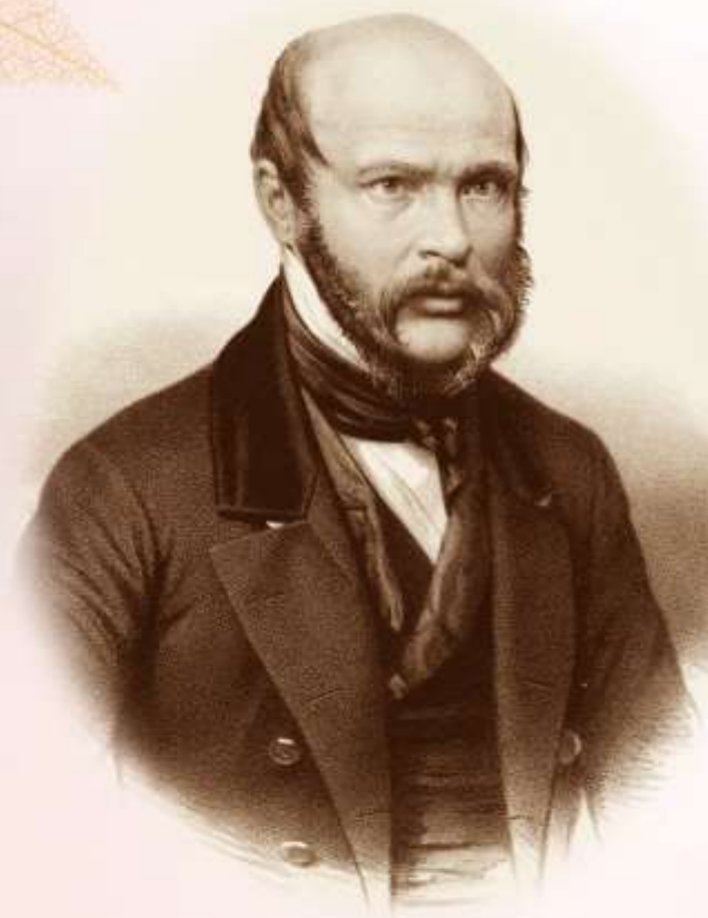
Николай Иванович Пирогов

«Не учивши дитя, можно вырастить круглого невежду; но если его не воспитывать, то оно воспитается собственными средствами, и вся разница будет заключаться в том, что оно может воспитаться дурно тогда, когда могло воспитаться разумно и правильно».