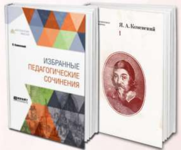
Ян Амос Коменский

«Следует как можно больше заботиться о том, чтобы искусство внедрять настоящим образом нравственность было поставлено надлежащим образом в школах, чтобы школы стали, как их называют, "мастерскими людей"».