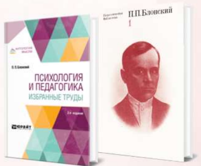
Павел Петрович Блонский

«Педагог должен быть сам воспитанным и образованным человеком. Поэтому подготовка педагога должна начинаться с его собственного воспитания и образования».