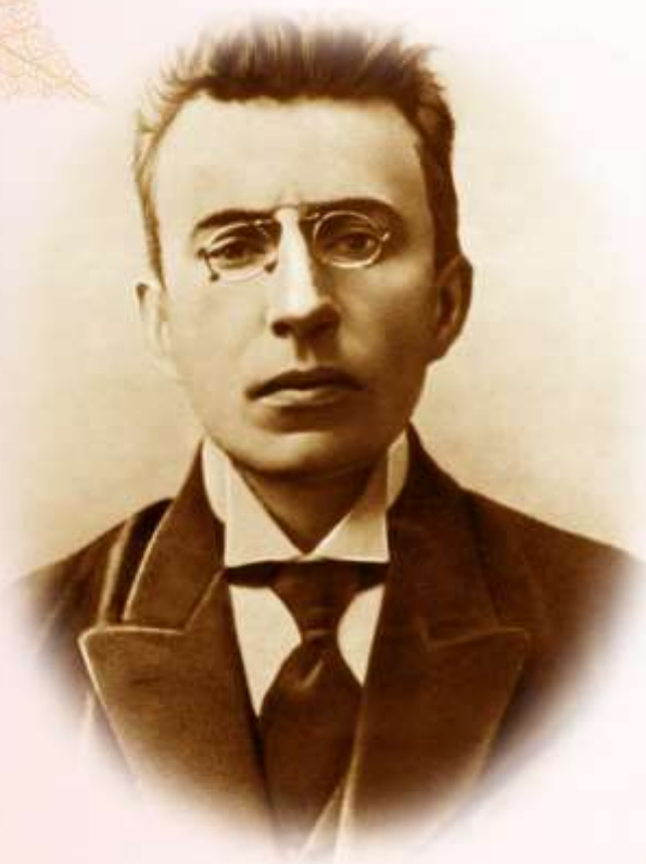
Антон Семёнович Макаренко

«Не думайте, что вы воспитываете ребенка только тогда, когда с ним разговариваете, или поучаете его, или приказываете ему. Вы воспитываете его в каждый момент вашей жизни, даже тогда, когда вас нет дома».