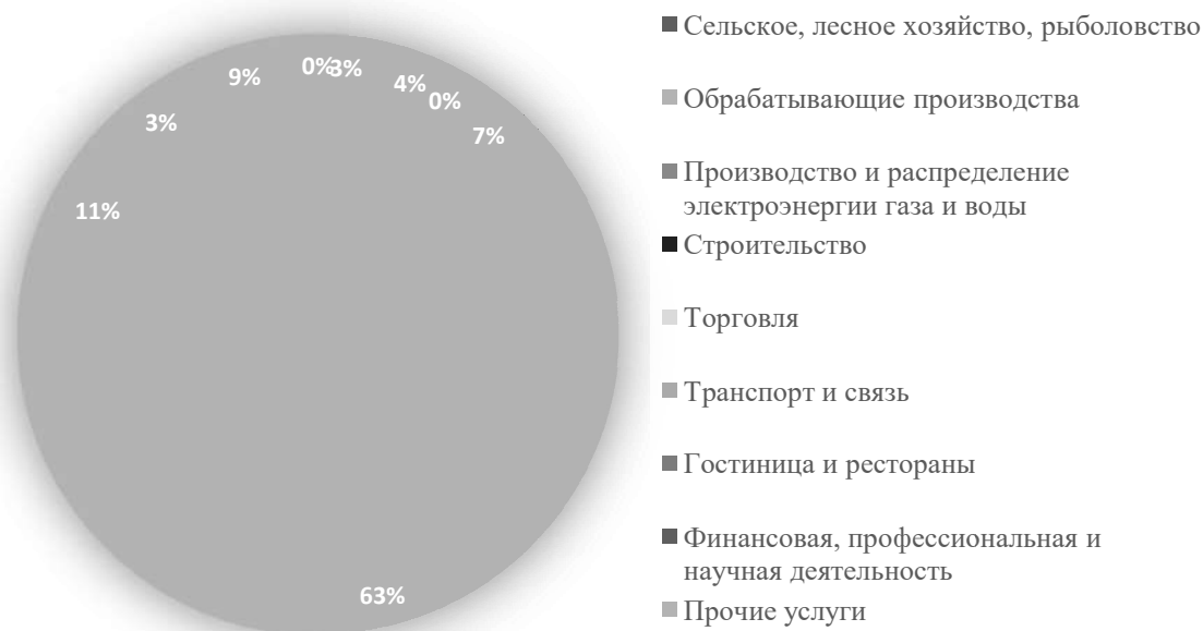
Рис. 2. Удельный вес МСБ в отраслях.

Для проверки гипотезы влияния малого и среднего бизнеса на развитие региона, создадим модель, которая поможет нам убедиться в значимости МСБ.