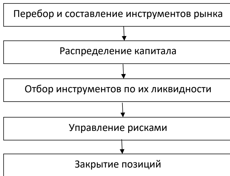
Рис. 2. Общая схема ведения торговли с помощью автоматической торговой системы

На рис. 2 представлена общая схема ведения торговли с помощью автоматической торговой системы.