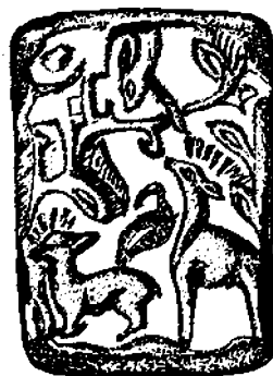
Праща из погребения 11. Аткарский грунтовой могильник

для мордовских могильников названного времени. В мужских могилах найдены боевые топоры, ножи с горбатой спинкой, кресала, стрелы. В двух погребениях в изголовье положена голова коня с удилами и стременами. Для женских захоронений типичен набор из