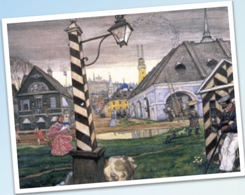
М. В. Добужинский. Провинция.