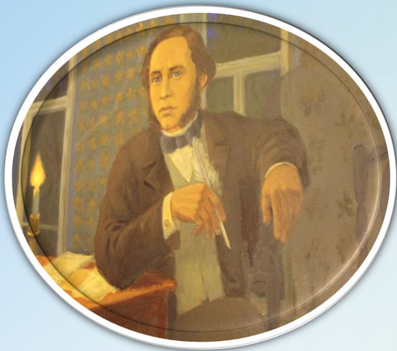
Таким запомнился вятчанам молодой Салтыков. Автор картины А. Потехин