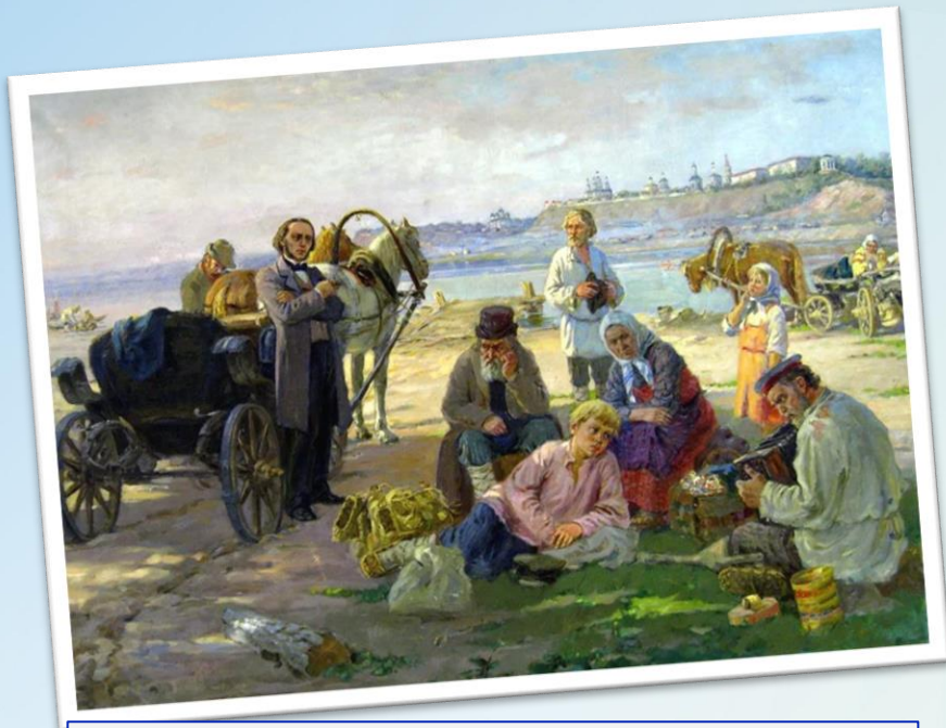
Картина художника Алексея Потехина "Приезд в Вятку"