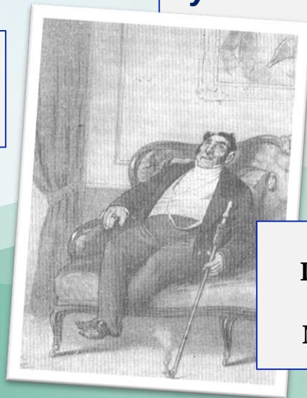
«Губернские очерки». Порфирий Петрович. Литография П. Ф. Бореля с рисунка М. С. Башилова. 1869 – 1870-е годы.