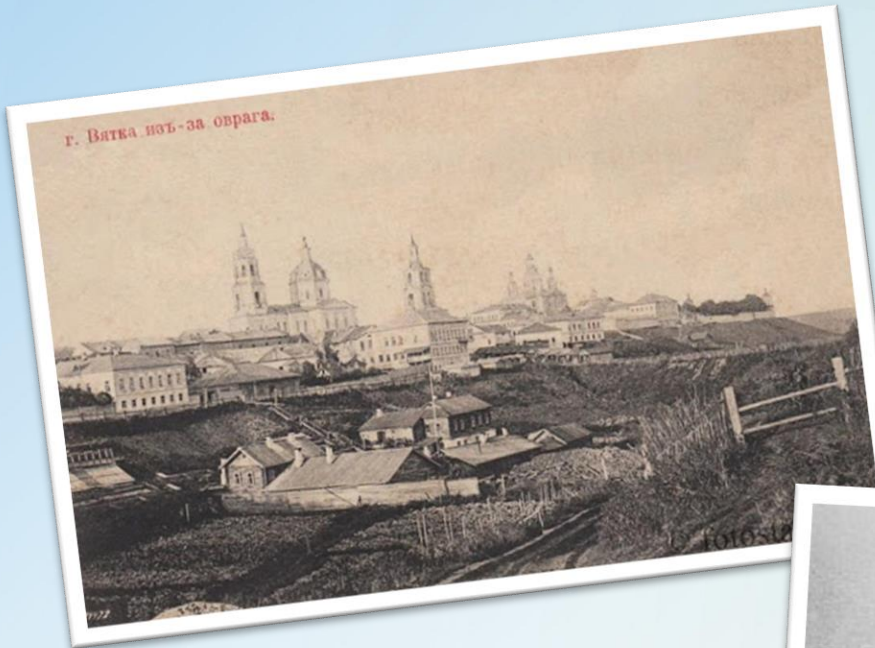
Виды Вятки, 19 в.

К несчастью, эти повести попали в руки Николая I. Салтыкова арестовали и обвинили в распространении вредных идей, которых царь очень боялся. Салтыкова отправляют в бессрочную ссылку - в Вятскую губернию.