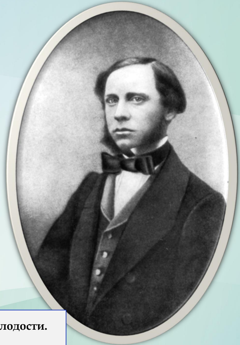
М.Е. Салтыков-Щедрин в молодости. 1850-е годы

Восемнадцатилетний выпускник лицея Салтыков поступает на службу в канцелярию Военного министерства Санкт-Петербурга. Впереди простирается блестящее политическое будущее, но молодому человеку скучно, он бросает службу и увлекается литературой и поисками идеала справедливого общества.