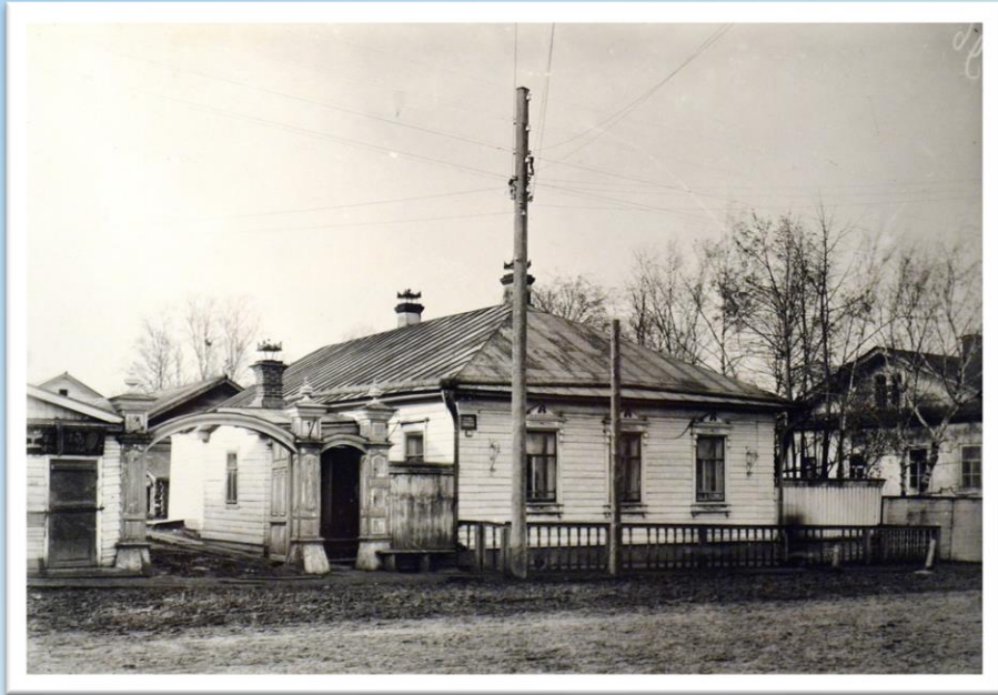
Дом в Вятке на Вознесенской улице, в котором М. Е. Салтыков проживал во время ссылки. Фото начала XX в.