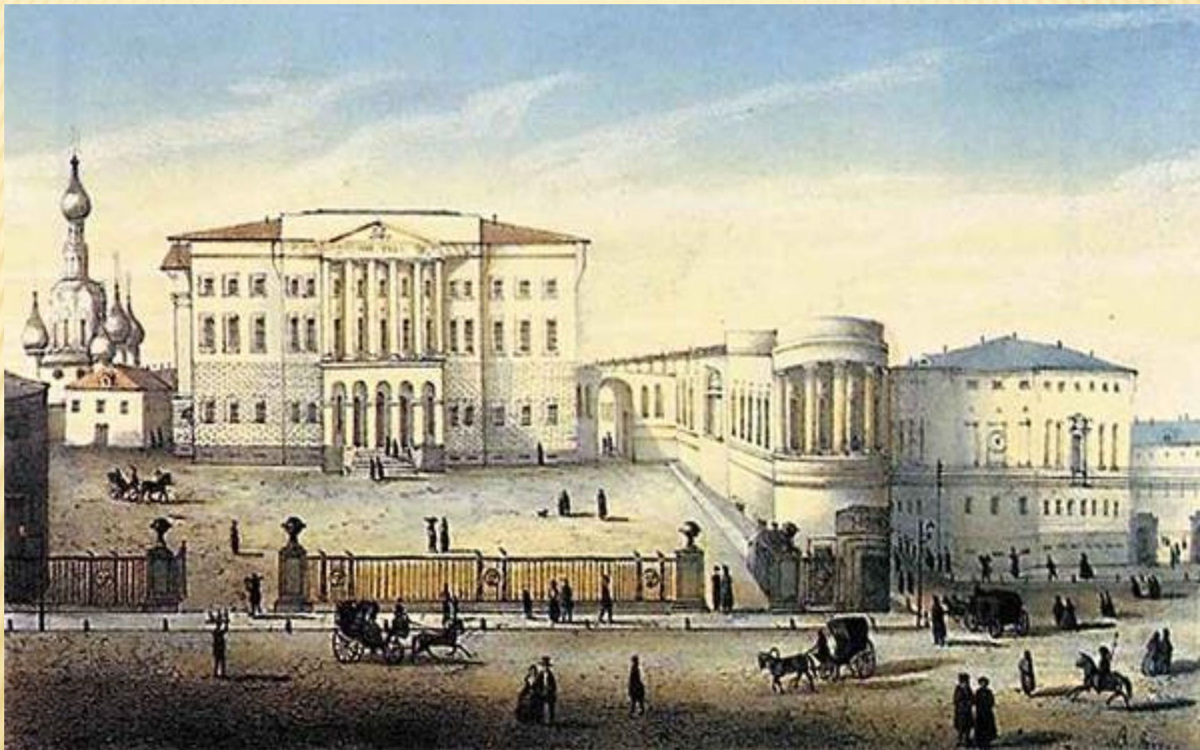
Московский университет в XIX веке