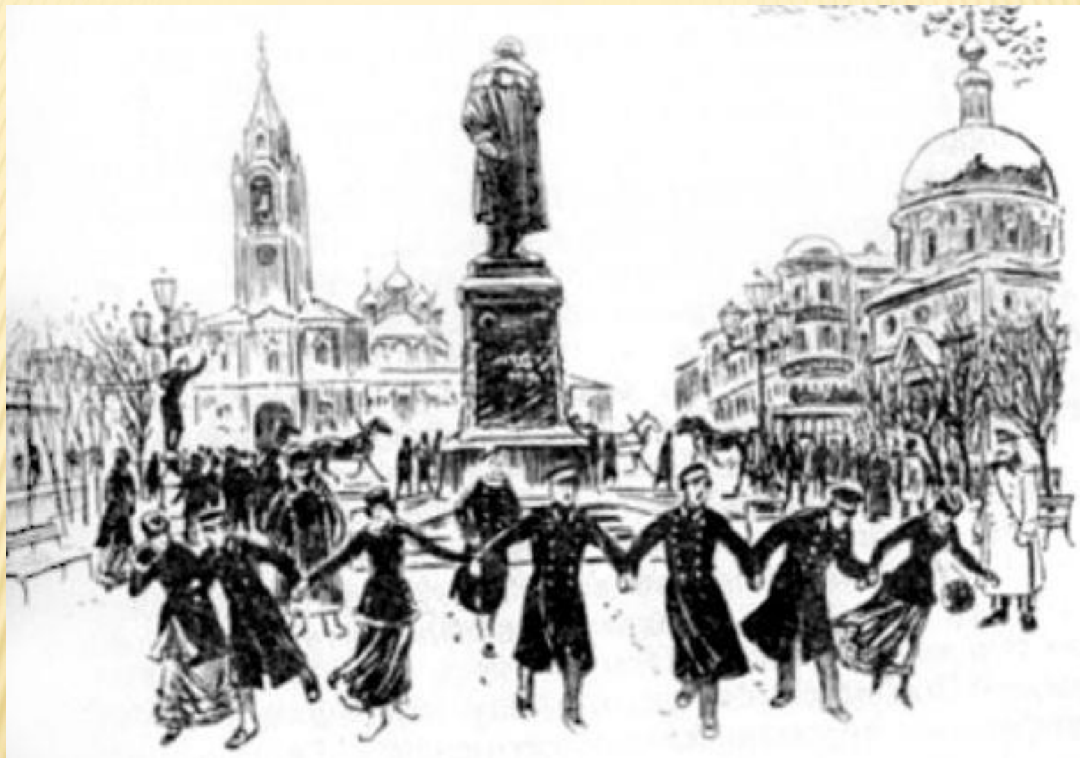
Студенческие гуляния на Тверском бульваре