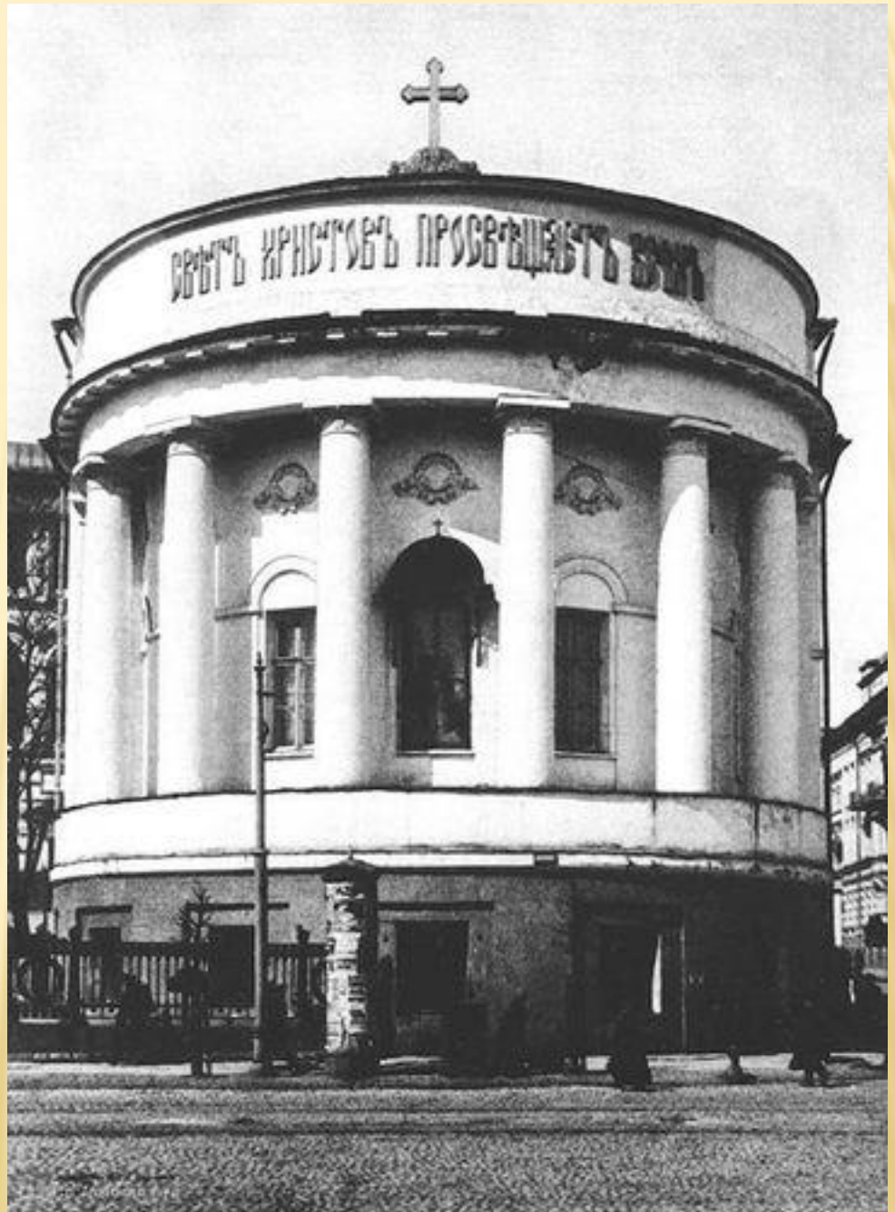
Татьянинская церковь МГУ. Фото сделано около 1913 года