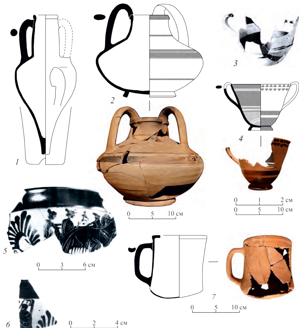
Рис. 3. Предметы из ямы № 1/1985 г. из Гермонассы: 1 – Лесбос (ТмГс-85, я.1); 2 – двуручный кувшин (Ф-1603); 3, 4 – хиосские кубки (3 – по: Korovina 2002: 38, рис. 9; без масштаба; 4 – Ф-1594); 5 – чернофигурный скифос (Ф-1592; по: Korovina 2002: XII, табл. 9, 9); 6 – фрагмент венца чернофигурного килика (по: Korovina 2002: табл. 9, 1); 7 – красноглиняная «кружка» (Ф-1596). Москва, ГМИИ им. А.С. Пушкина, ОИААМ

в печи № 2 на городище Тиритака и датирована второй половиной VI в. до н.э. 35 Схожие характеристики имеет и амфора последней четверти VI в. до н.э. из ямы № 41 в Нимфее 36 . Сосуд из Гермонассы отличается более вытянутой нижней частью тулова. Возможно, его датировка заходит в самое начало V века до н.э.