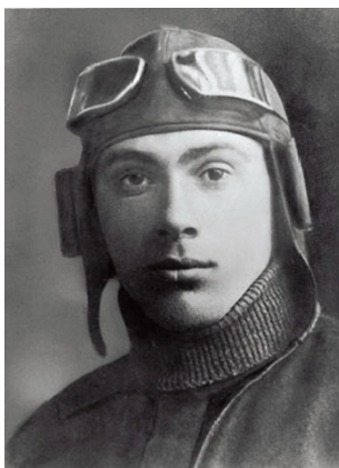
Капитан Н. Гастелло