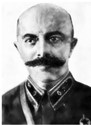
Генерал-майор Г. Шульц