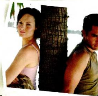
Рис.1. Фрагмент темы учебника English File 3rd Edition Pre-Intermediate

The holiday began well. We spent two days in Bangkok and saw the Floating Market and the Royal Palace. But things went wrong when we left Bangkok. I wanted to stay in hostels , which were basic but clean, but Mia said they were too uncomfortable and so we stayed in quite expensive hotels. I wanted to experience the local atmosphere but Mia just wanted to go shopping. I thought I knew Mia very well, but you don't know a person