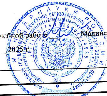
ГРАФИК УЧЕБНОГО ПРОЦЕССА НА 2025-2026 УЧ. ГОД