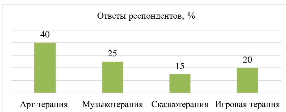
Рис. 1 Какие методы творческого развития наиболее эффективны для детей с ОВЗ?

Результаты опроса представлены на рисунках 1 –3. В качестве наиболее эффективных методов творческого развития детей с ОВЗ, по мнению студентов, представлены арт-терапия и музыкотерапия (рис. 1).