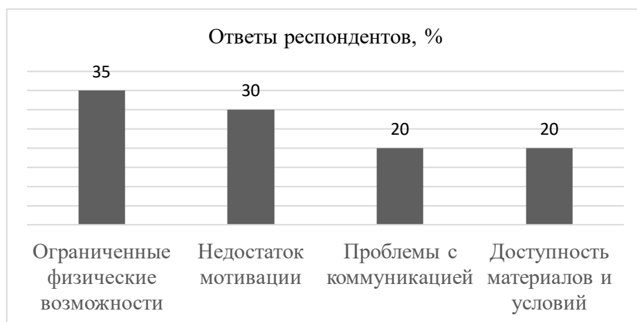
Рис. 2 Какие основные трудности встречаются у детей с ОВЗ в творческой деятельности?

Большинство респондентов считают, что планирование творческой деятельности для детей с ОВЗ является очень важным и имеет большое значение при планировании индивидуального развития детей (рис.3).