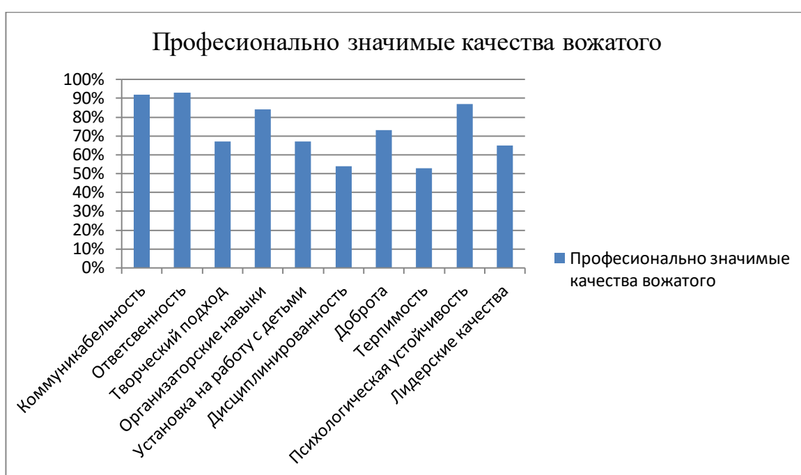
Рис 1. Профессионально значимые качества вожатого с позиции обучающихся на данную должность

В частности, среди обучающихся 2024 года (студенты 9 вузов г. Воронежа) был проведен опрос с целью выявления существенных профессионально значимых качеств и обозначения эффективных инструментов их формирования с позиции самих респондентов. В опросе приняли участие 234 человека, им было предложено выбрать 10 профессионально значимых качеств вожатого и 10 более эффективных педагогических инструментов формирования данных качеств. Результаты выбора студентов представлены на рисунке 1. и рисунке 2.