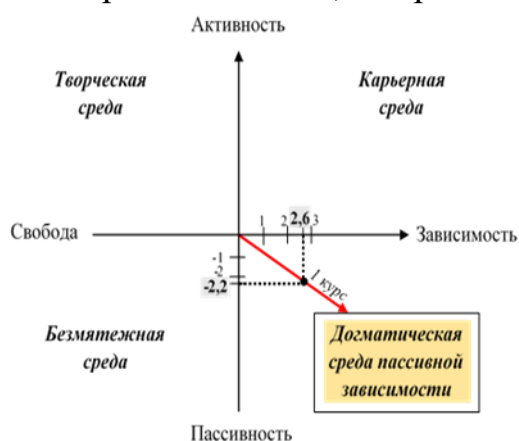
Рис. 1. Фактический вектор образовательной среды духовной семинарии

Итак, по оси пассивность-активность, мы имеем показатель «-1 балл» и таким образом диагностируем догматическую среду пассивной зависимости. На рисунке представлена векторная направленность образовательной среды духовной семинарии, полученная подсчетом среднего бала после ответов 60 студентов и преподавателей, выбранных случайно (Рис 1).