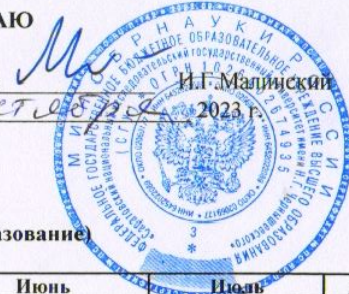
График учебного процесса на 2023/2024 уч.г. на механико-математическом факультете СГУ заочная форма обучения Направление 44.03.01 - ПЕДАГОГИЧЕСКОЕ ОБРАЗОВАНИЕ (профиль - математическое образование)