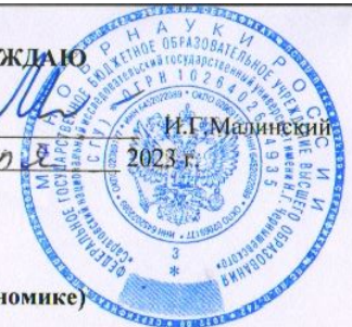
График учебного процесса на 2023/2024 уч.г. на механико-математическом факультете СГУ заочная форма обучения Направление 09.04.03 - ПРИКЛАДНАЯ ИНФОРМАТИКА (профиль - Прикладная информатика в экономике)