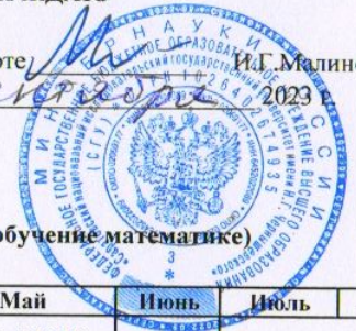
График учебного процесса на 2023/2024 уч.г. на механико-математическом факультете СГУ заочная форма обучения Направление 44.04.01 - ПЕДАГОГИЧЕСКОЕ ОБРАЗОВАНИЕ (профиль - Профессионально ориентированное обучение математике)