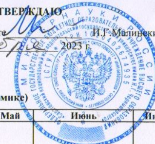
График учебного процесса на 2023/2024 уч.г. на механико-математическом факультете СГУ заочная форма обучения Направление 09.03.03 - ПРИКЛАДНАЯ ИНФОРМАТИКА (профиль - Прикладная информатика в экономике)