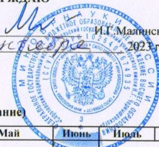
График учебного процесса на 2023/2024 уч.г. на механико-математическом факультете СГУ заочная форма обучения Направление 44.04.01 - ПЕДАГОГИЧЕСКОЕ ОБРАЗОВАНИЕ (профиль - Математическое образование)