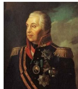
В) М.И. Кутузов