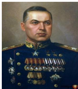
Б) К.К. Рокоссовский