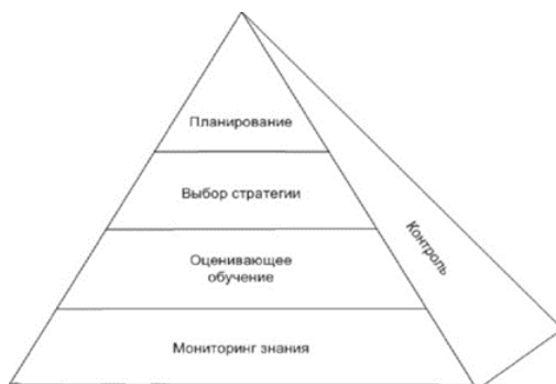
Рис. Иерархическая модель метапознания Тобиаса и Эверсона

Исследование метакогнитивных процессов в контексте оценки процесса принятия решения является в настоящее время, одним из интереснейших направлений в метакогнитивной психологии. Важность исследований обуславливается во многом большей представленностью рассматриваемого класса процессов именно в деятельности юриста.