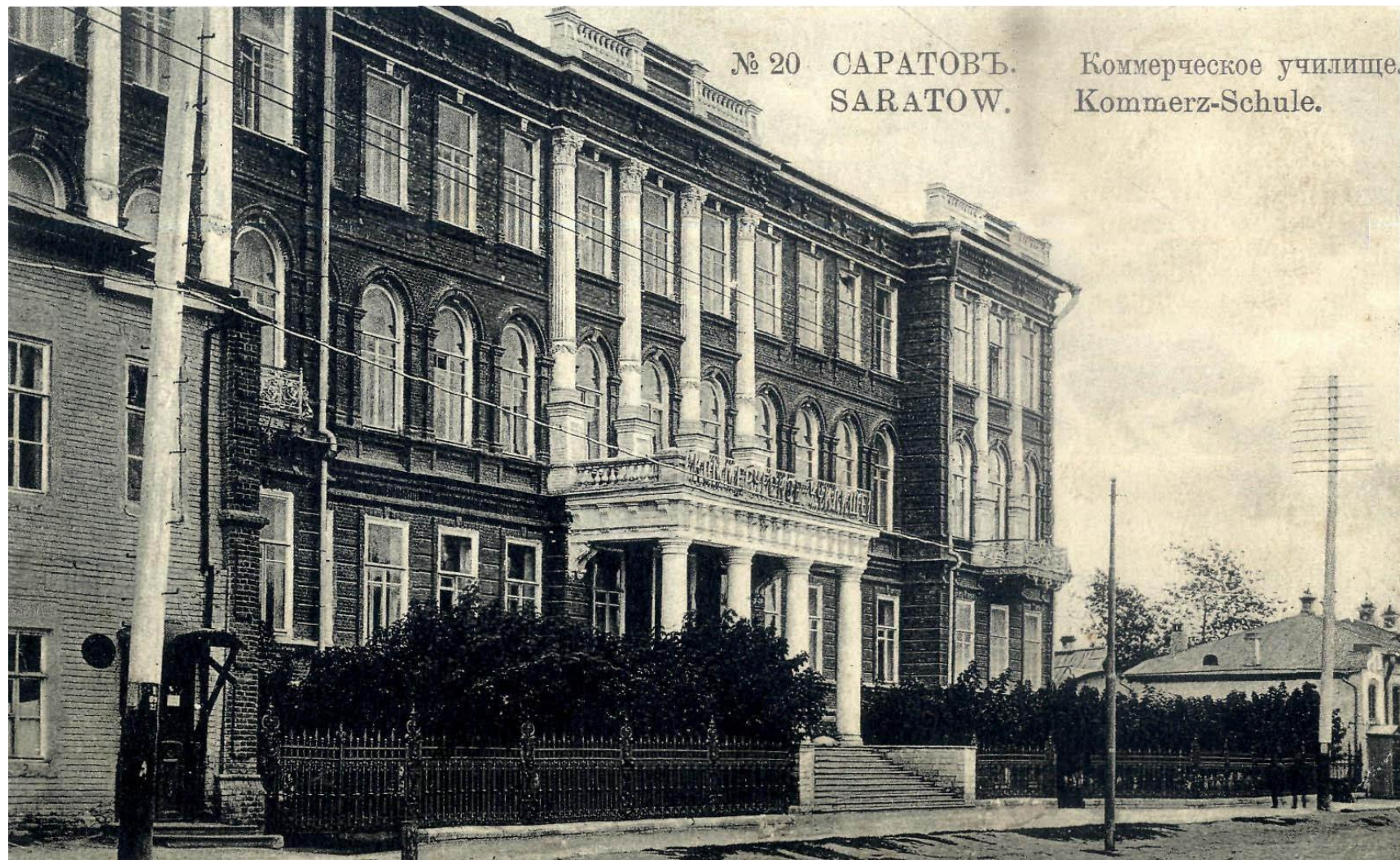
Здание Саратовского Коммерческого училища (ул. Константиновская, ныне - ул. Советская)