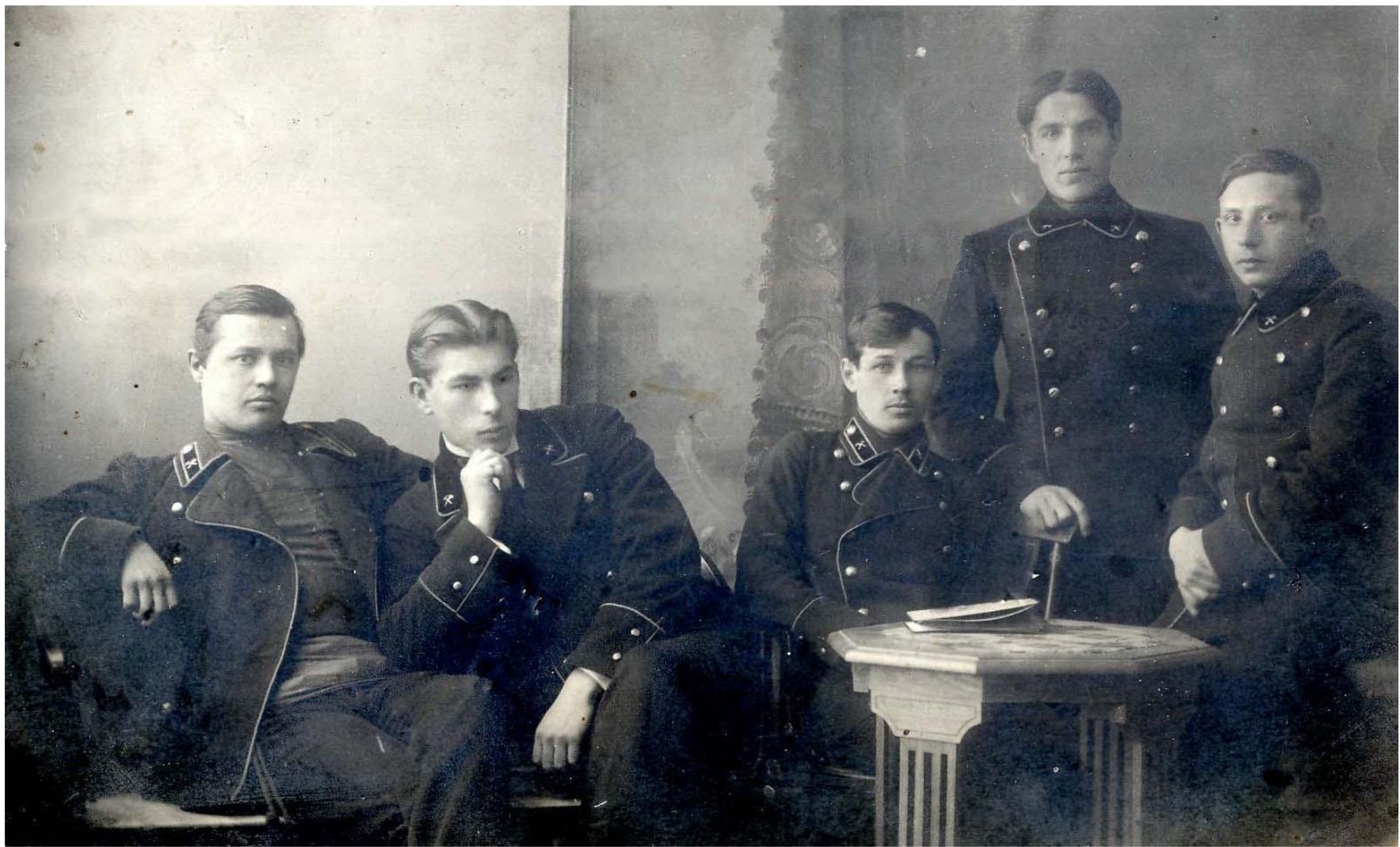
Учащиеся технического училища