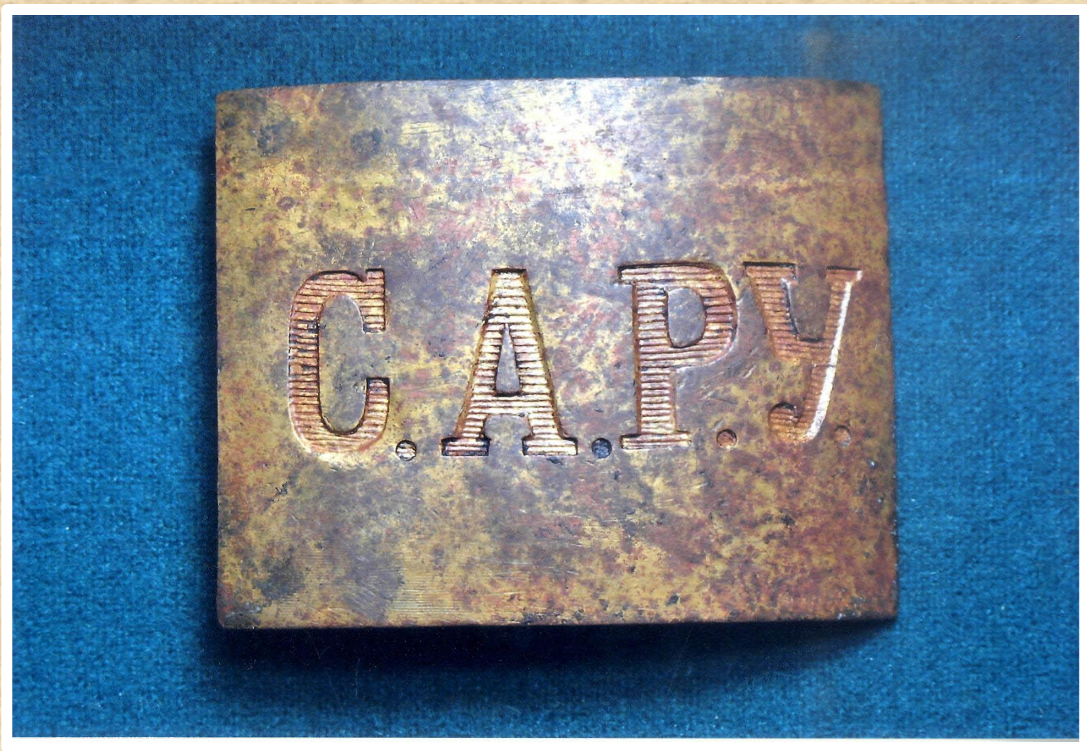
Поясная бляха Саратовского Александровского ремесленного училища