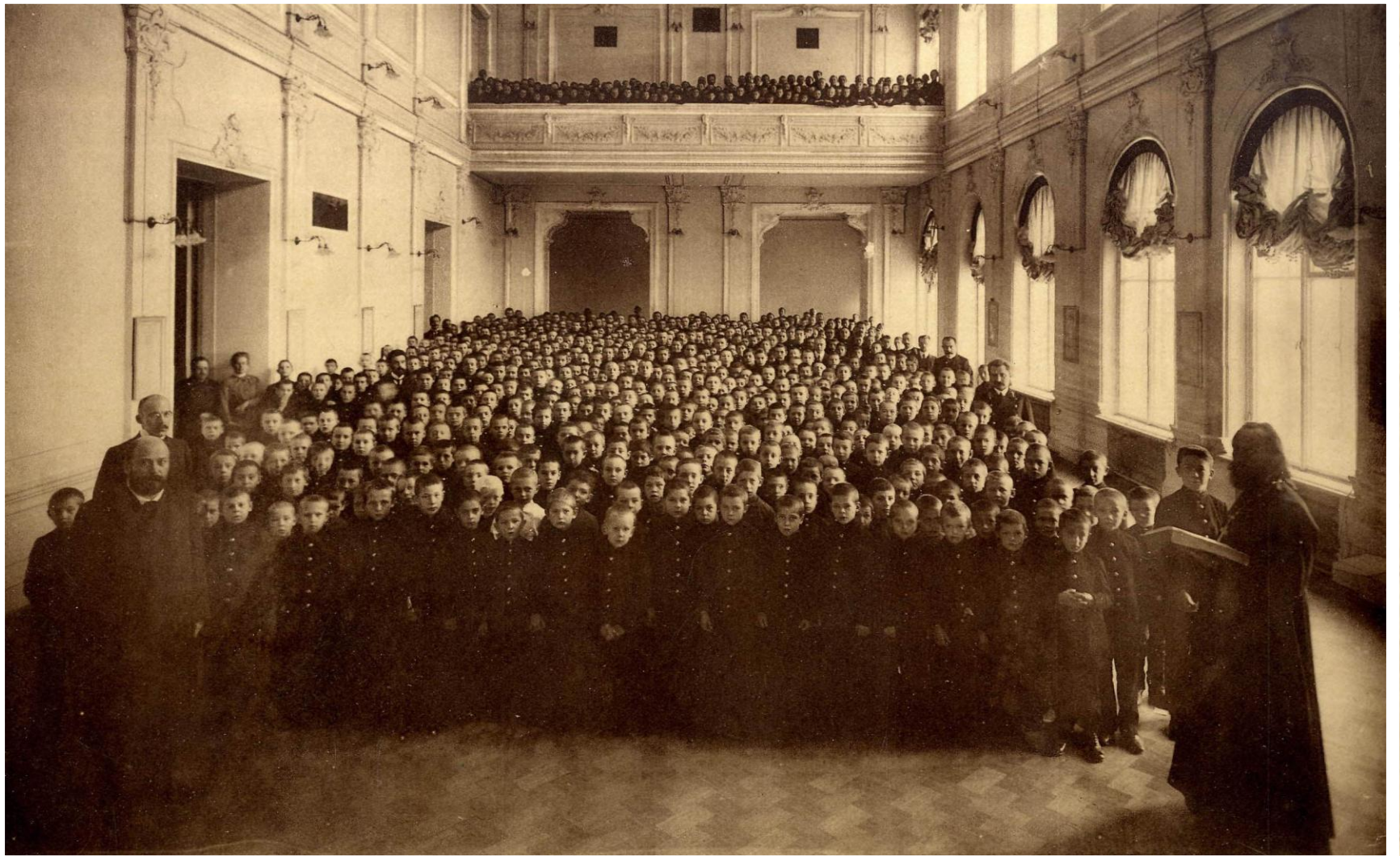
Учащиеся Саратовского Коммерческого училища на молитве