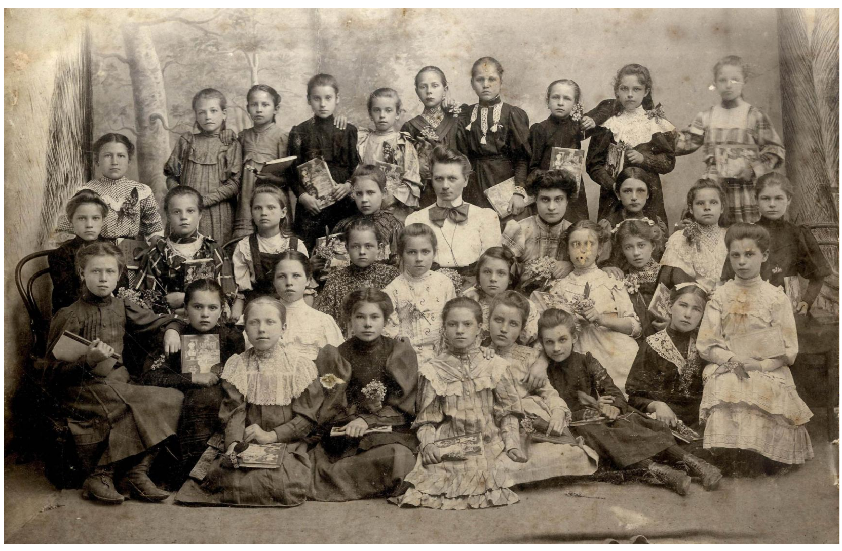
Учащиеся 4-го городского училища Министерства народного просвещения