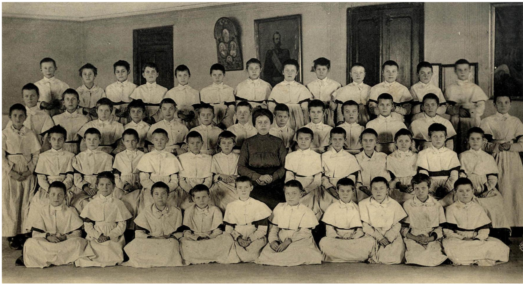
Учащиеся 1-го класса епархиального училища