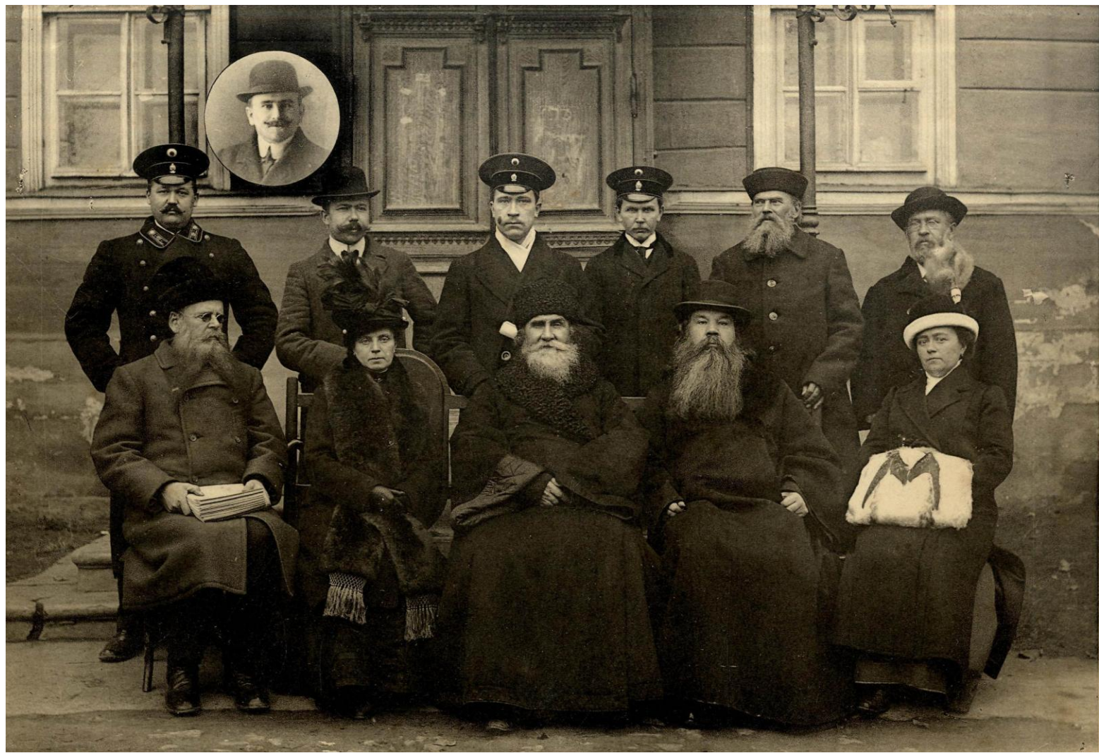
Педагогический коллектив епархиального женского училища