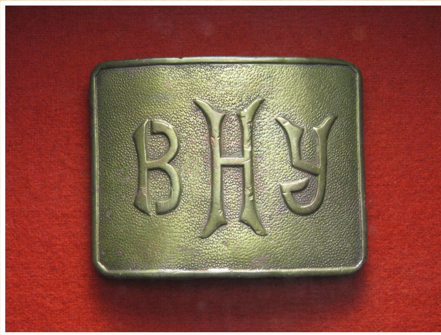
Поясная бляха Саратовского Высшего начального училища