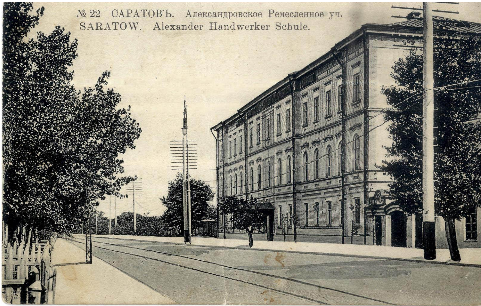
Здание Александровского Ремесленного училища

№ 22 САРАТОВЪ. Александровское Ремесленное уч. SARATOW. Alexander Handwerker Schule.