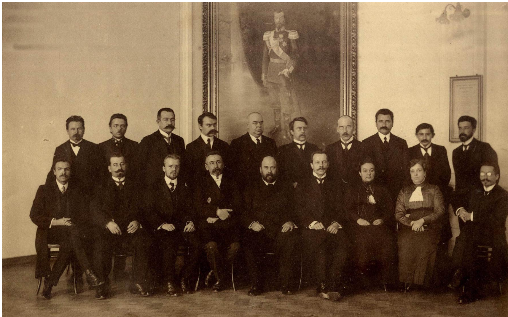
Педагогический коллектив Саратовского Коммерческого училища, 1913 – 1914 г.