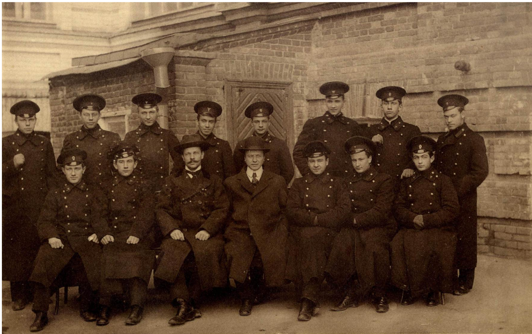
Преподаватели и учащиеся 7-го класса Саратовского Коммерческого училища, 1913 – 1914 учебный год