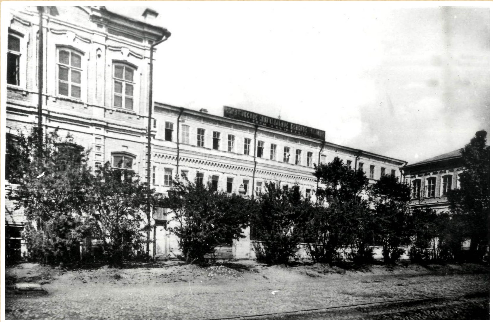
Здание епархиального женского училища