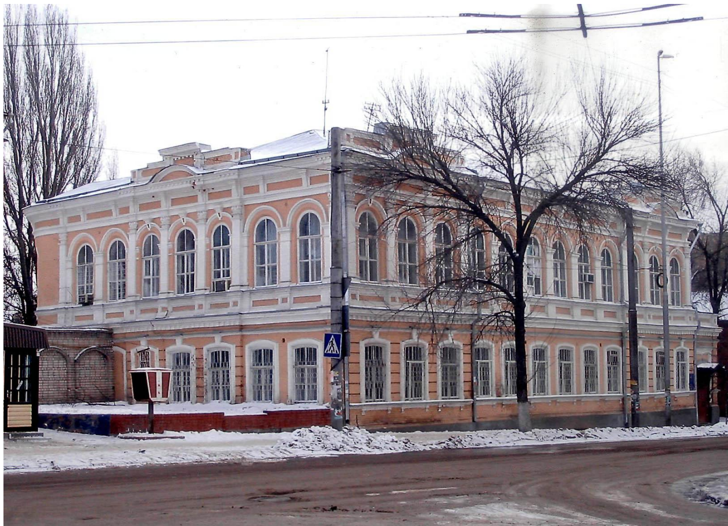
Здание 2-го Саратовского Высшего начального училища Министерства народного просвещения