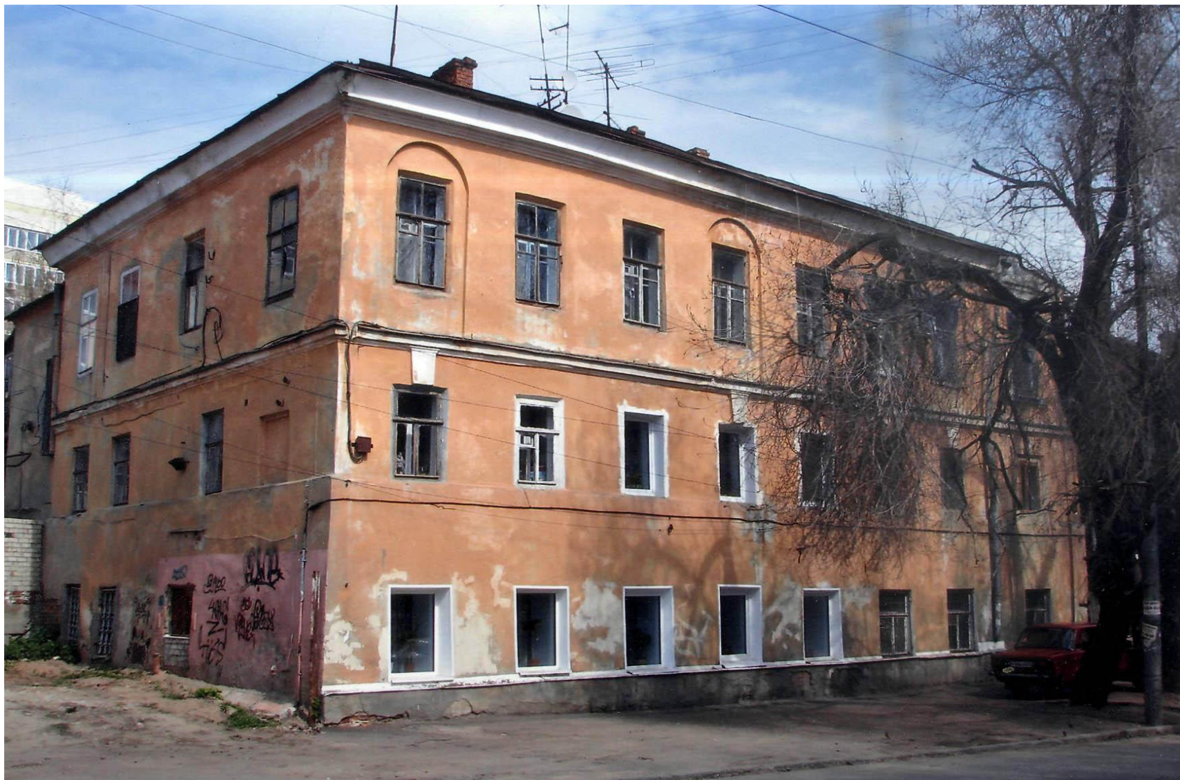
Здание 4-го городского училища Министерства народного просвещения