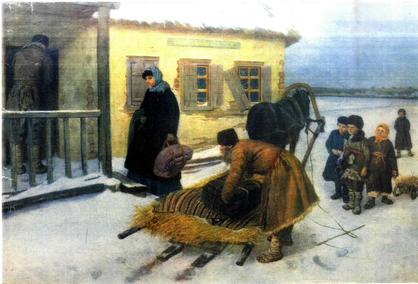
К. А. Трутовский (1826—1893). ПРИЕЗД УЧИТЕЛЬНИЦЫ. 1885 год.