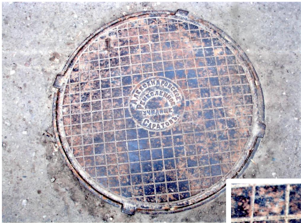
Крышка люка, изготовленная учащимися Саратовского Александровского ремесленного училища