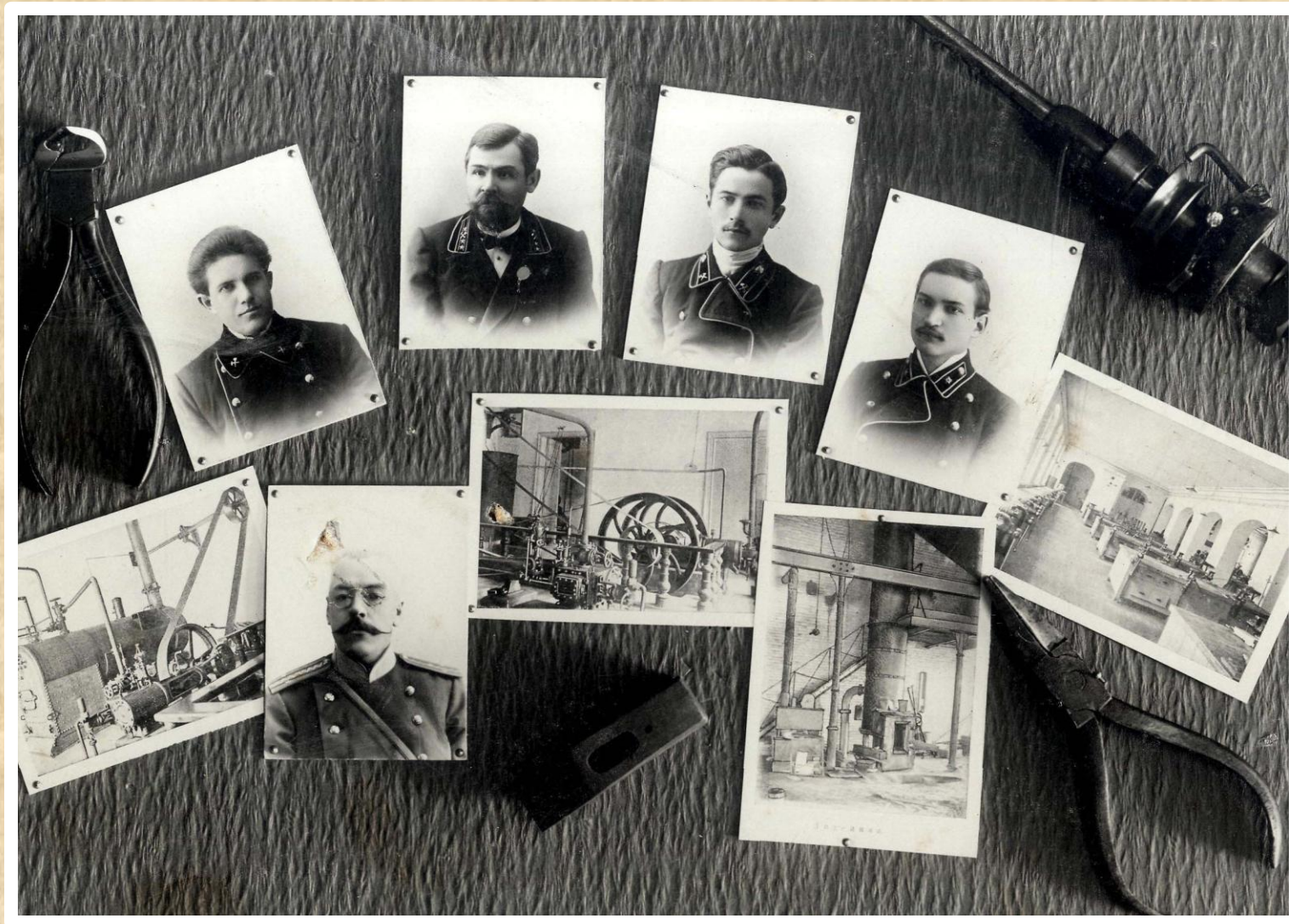
Страница из выпускного альбома