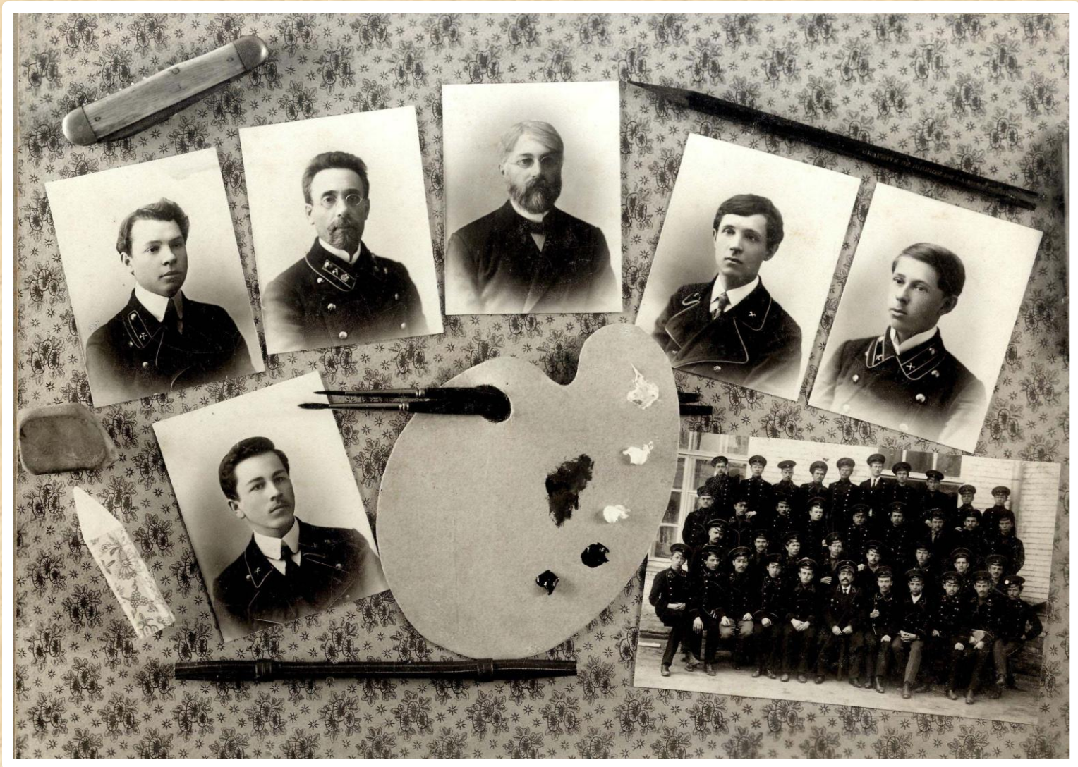
Страница из выпускного альбома