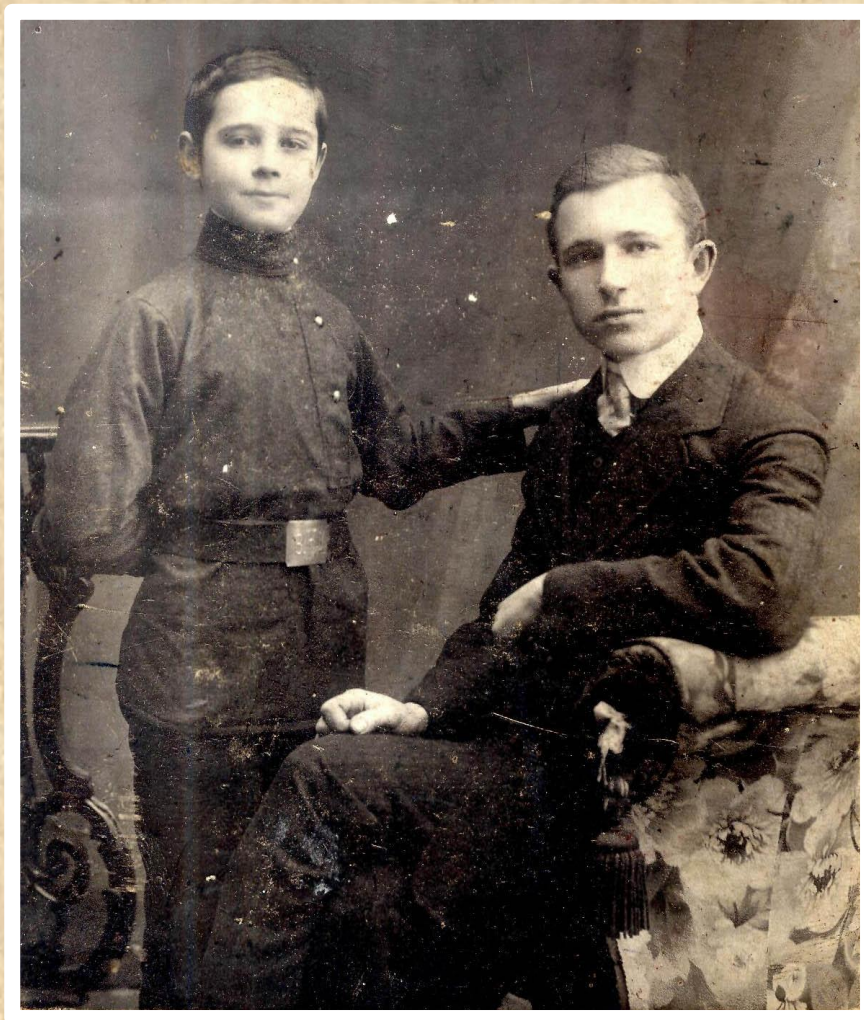
Учащийся Саратовского Высшего начального училища