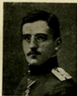
Его Высочество Королевичъ Александръ, Главномандующій войсками Серби.