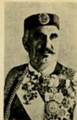
Его Величество Король Черногории НИКОЛАЙ I.