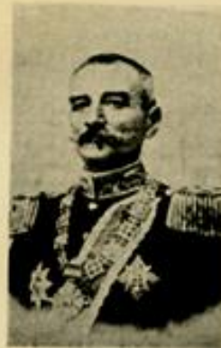
Его Величество Король Серби ПЕТРЪ I.