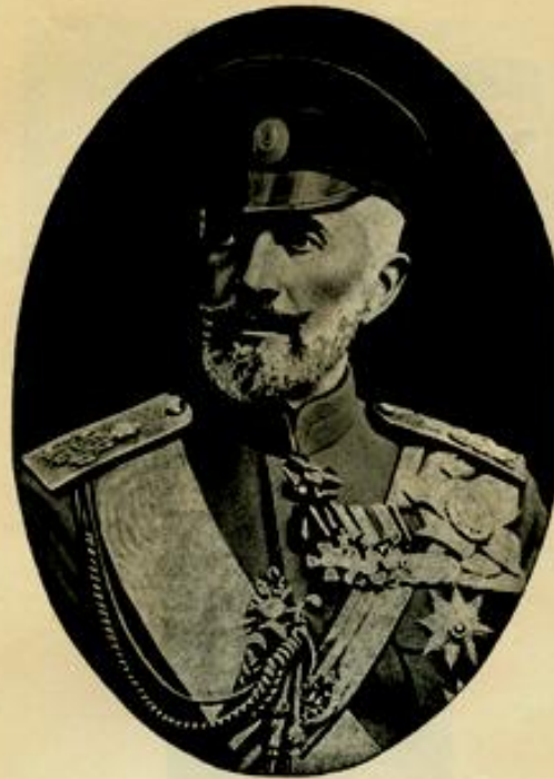
Его Императорское Высочество Государь Великий Князь НИКОЛАЙ НИКОЛАЕВИЧЪ, Верховный Главнокомандующий славянской ратью.