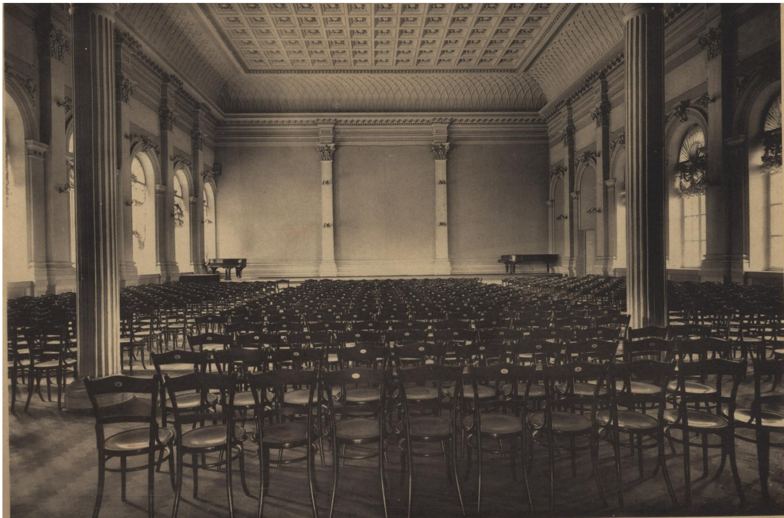
Большой концертный зал консерватории