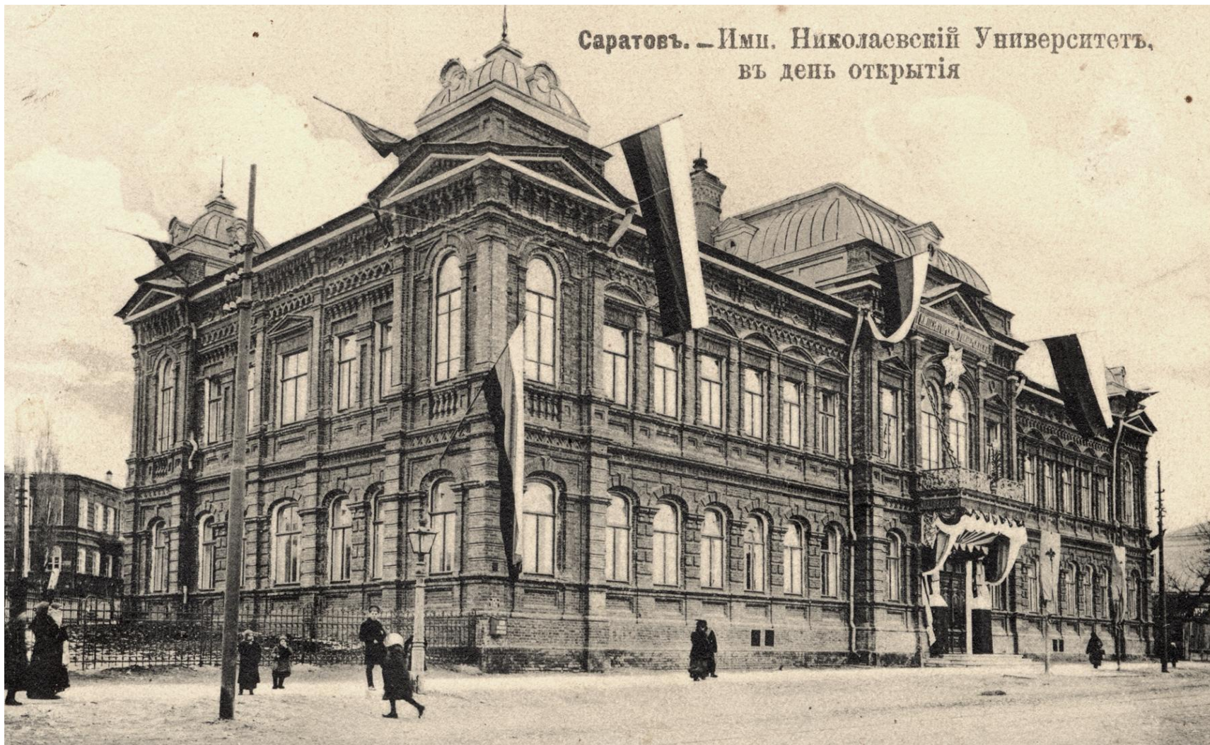
Здание Саратовскаго Императорскаго Николаевскаго университета в день открытія (ул. Большая Сергеевская, ныне — ул. Чернышевскаго)