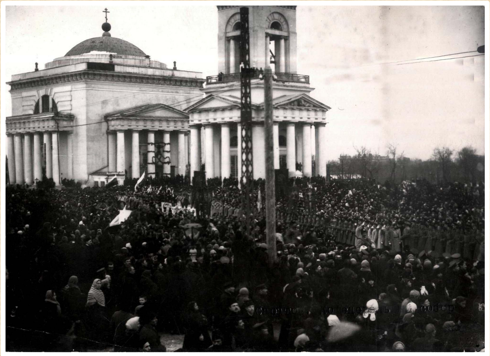
Крестный ход к месту закладки зданий Саратовского университета у кафедрального собора, 6 декабря 1909 г.