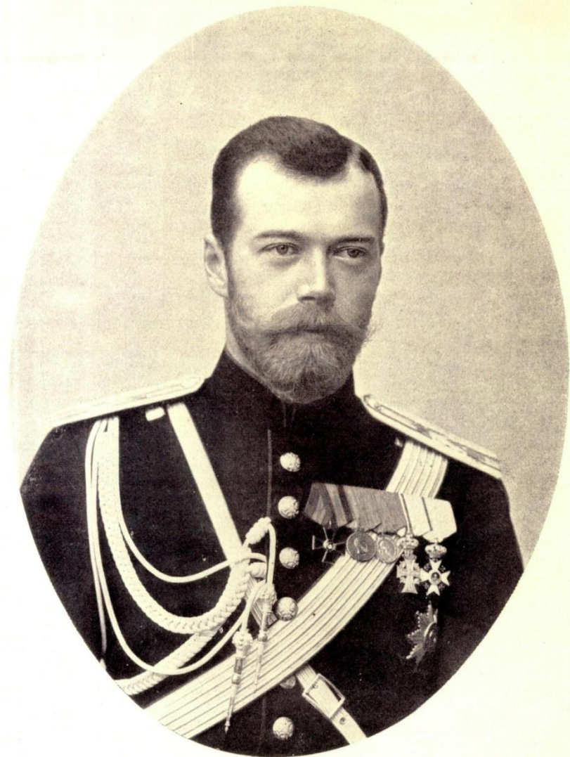
Его Императорское Величество Государь Императоръ Николай Александровичъ.