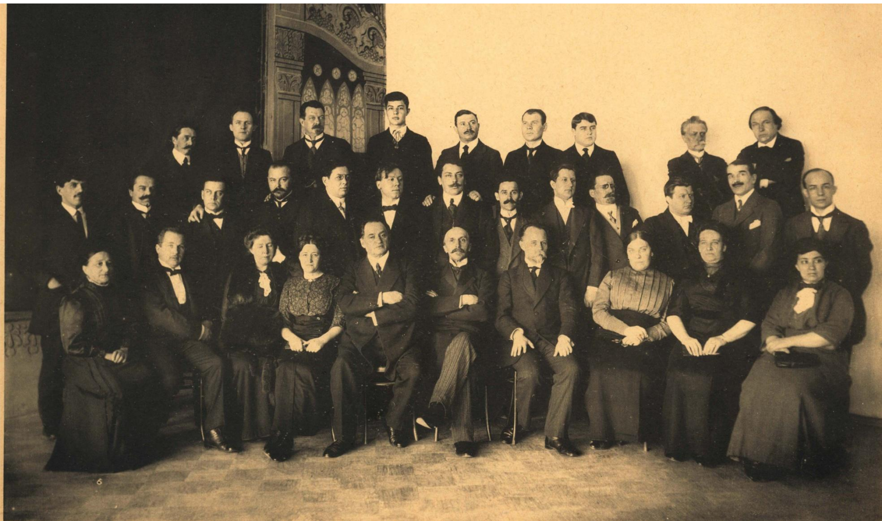
Педагогический коллектив консерватории