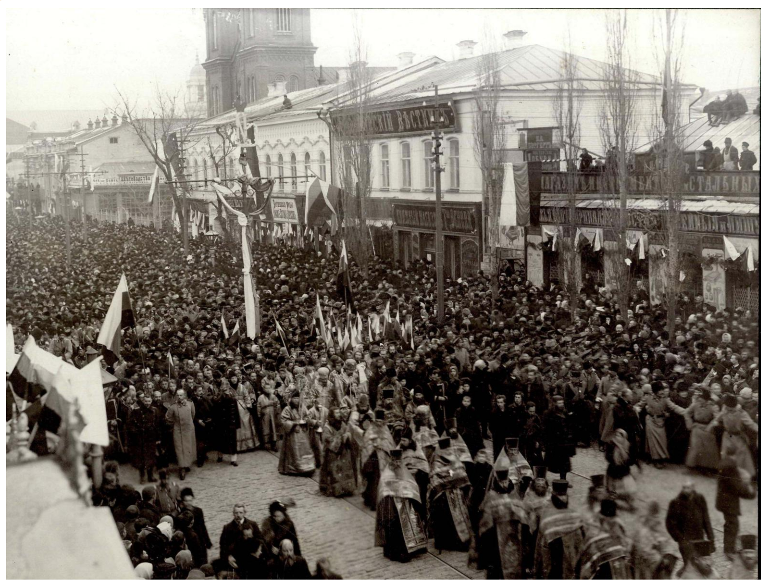
Крестный ход к месту закладки зданий Саратовского университета - ул. Немецкая (ныне пр. Кирова), 6 декабря 1909 г.