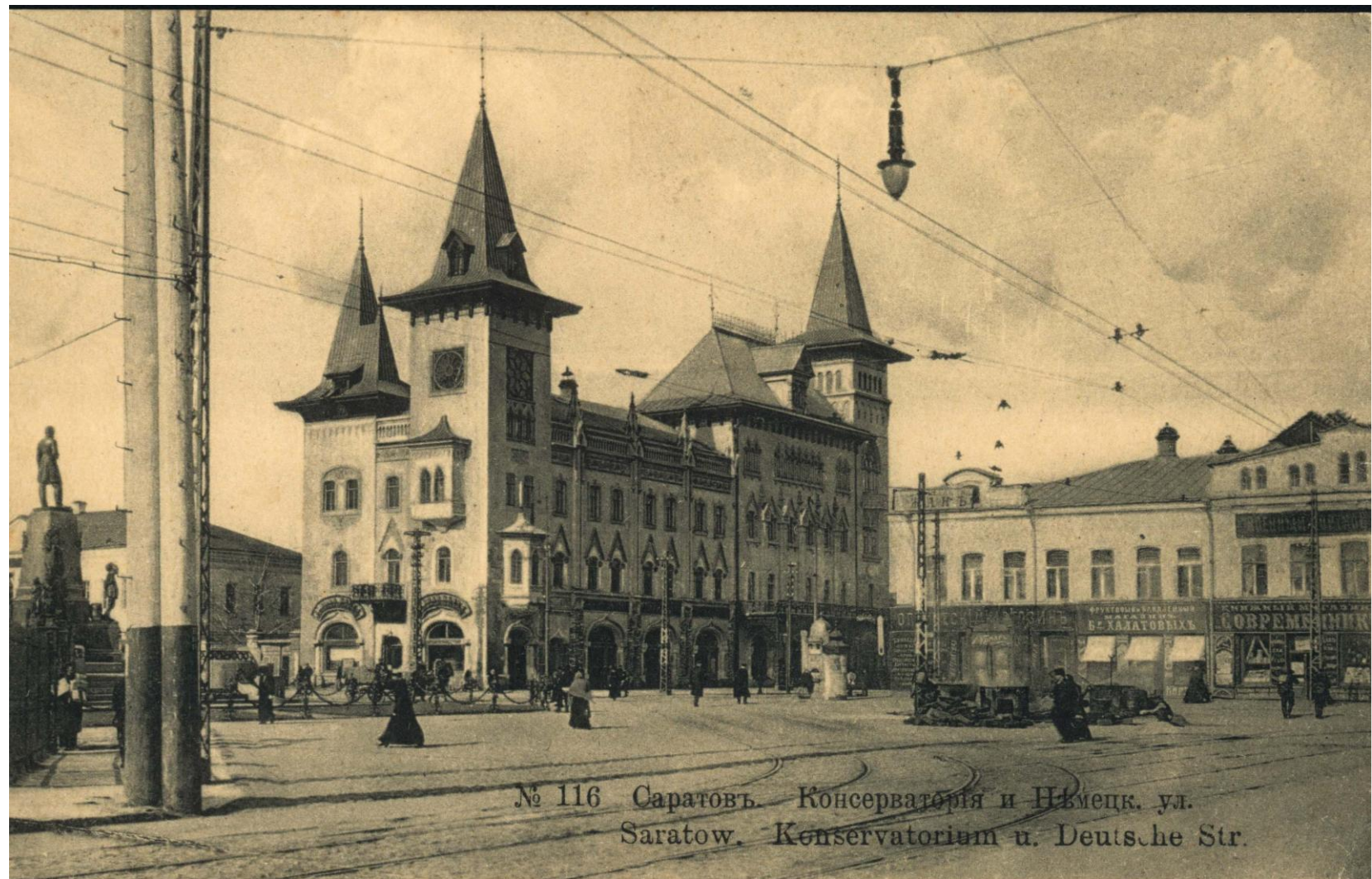
№ 116 Саратовъ. Консерваторія и Нѣмецк. ул. Saratow. Konservatorium u. Deutsche Str.

Здание консерватории - угол ул. Никольской (ныне - ул. Радищева) и Немецкой (ныне - проспект Кирова)