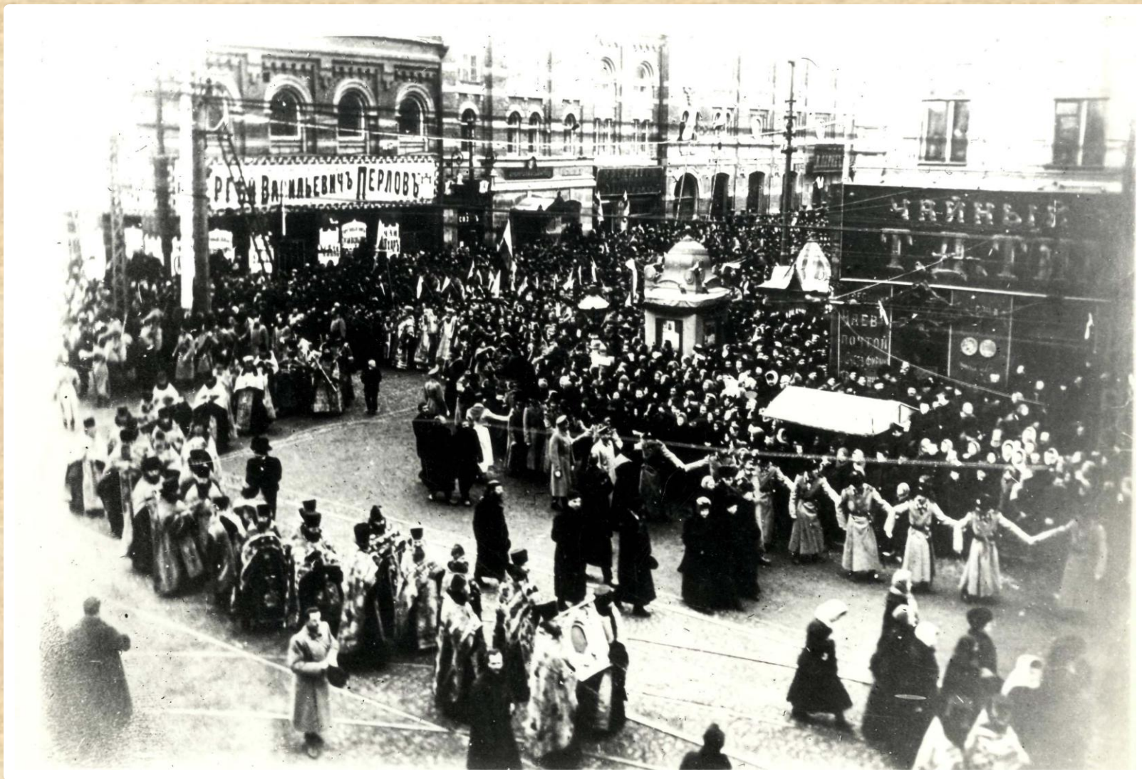
Крестный ход к месту закладки зданий Саратовского университета - ул. Московская, 6 декабря 1909 г.