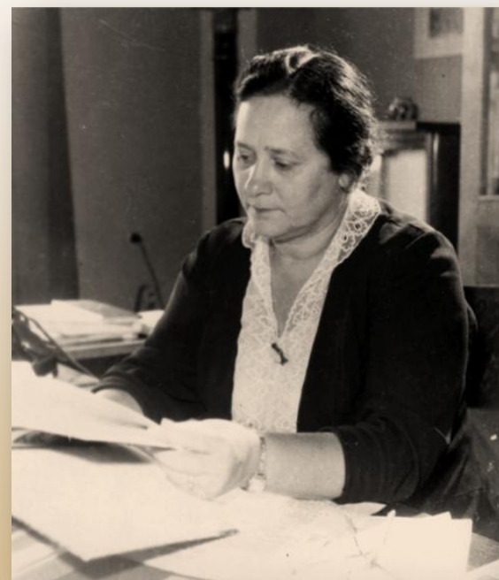
В. А. Артисевич

Зональная научная библиотека имени В. А. Артисевич Саратовского государственного университета имени Н. Г. Чернышевского