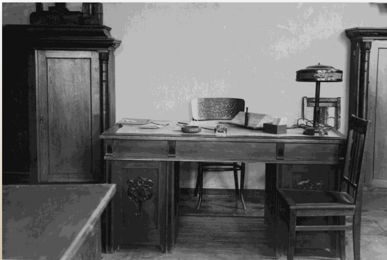
Кабинет И. А. Буссе (мебель сохранена по настоящее время)

Зональная научная библиотека имени В. А. Артисевич Саратовского государственного университета имени Н. Г. Чернышевского