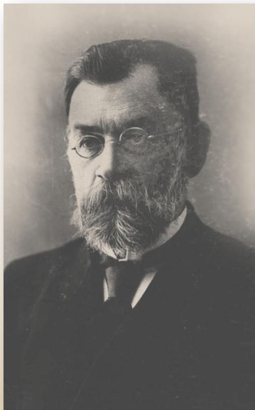
Первый Ректор Саратовского Университета Василий Иванович Разумовский

Зональная научная библиотека имени В. А. Артисевич Саратовского государственного университета имени Н. Г. Чернышевского