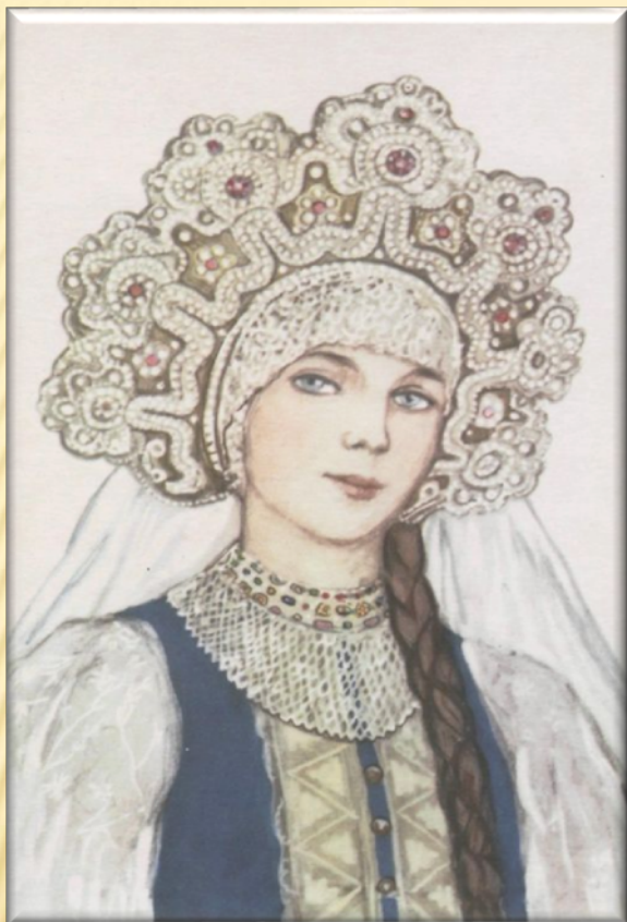
ВЕНЕЦ. АРХАНГЕЛЬСКАЯ ГУБЕРНИЯ

Как и у других народов, русские девушки могли ходить с непокрытой головой.