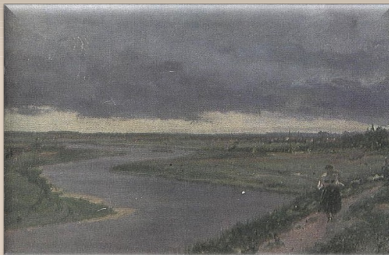
Алексей Петрович Боголюбов Из собрания Саратовского государственного художественного музея имени А. Н. Радищева

виртуальная выставка к 190-летию со дня рождения художника